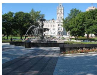
La Fontaine de Tourny

En vous dirigeant vers la rue Grande Allée par la promenade des Premiers-Ministres, vous passez devant le Parlement du Québec où siège l'Assemblée nationale du Québec. À votre droite, vous voyez la fontaine Tourny mise en eau le 3 juillet 2007 à l'aube du 400 e anniversaire de Québec.