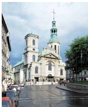
Basilique cathédrale de Québec

Construite sous le Régime français, elle fut gravement endommagée pendant le siège de 1759. Elle fut à nouveau incendiée en 1922 et reconstruite en 1925 à partir des mêmes plans. Le Centre d'animation François-de-Laval situé à l'intérieur de la Cathédrale, près de la chapelle dédiée à Monseigneur de Laval, vise à faire connaître la vie du premier évêque de Québec qui a donné son nom à l'Université. Le Centre est ouvert à l'année, tous les jours. Admission gratuite. En sortant de la basilique, à votre droite, vous avez le Petit Séminaire qui abrite également le Musée de l'Amérique française dont le centre d'accueil est situé au 2, côte de la Fabrique.