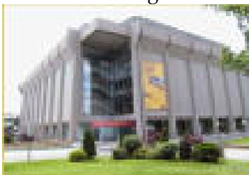
Grand Théâtre de Québec

A proximité, vous avez le Grand Théâtre de Québec. On y trouve deux salles dont une pour les concerts et l'autre pour le théâtre. C'est aussi le siège du Conservatoire de Musique de Québec.