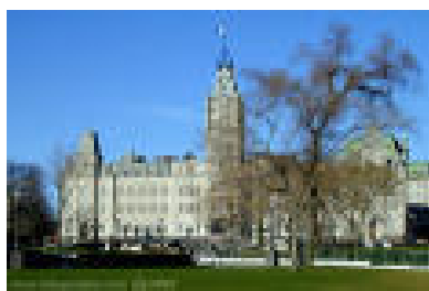
Parlement de Québec