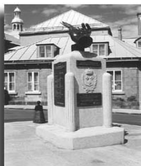
Monument aux enseignantes du Québec

Ce monument représente une main ouverte tenant une plume. Il a été installé et inauguré par les autorités publiques, en août 1997, pour rendre hommage à toutes les enseignantes qui, dans l'anonymat et le dévouement quotidien, ont consacré leur vie à l'enseignement et à l'éducation au Québec.