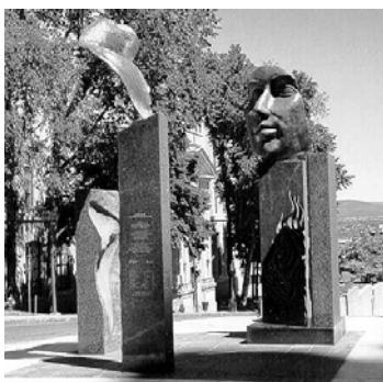
Sculpture à la mémoire des frères éducateurs

Allez au monument dédié aux frères enseignants des écoles chrétiennes. Il souligne leur contribution importante dans le domaine de l'éducation au Québec.